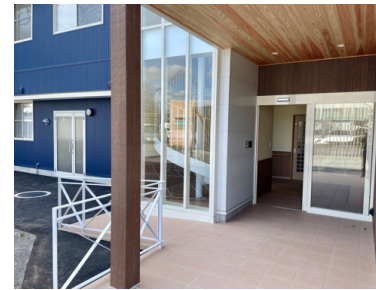
スロープを設けています。