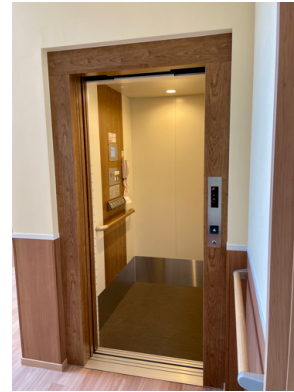
相談室 2階に相談室があります。エレベーターでお上がりください。