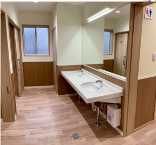
トイレ 車椅子から移乗できる広さのトイレが2箇所あります。右側と左側で2種類あり、片側麻痺の方に配慮しています。