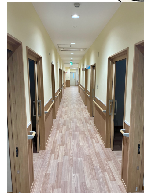
居室 9部屋ある居室は全て個室になっており、落ち着いて過ごすことができます。各部屋にナースコールも備えており、職員がすぐ対応できるようになっております。