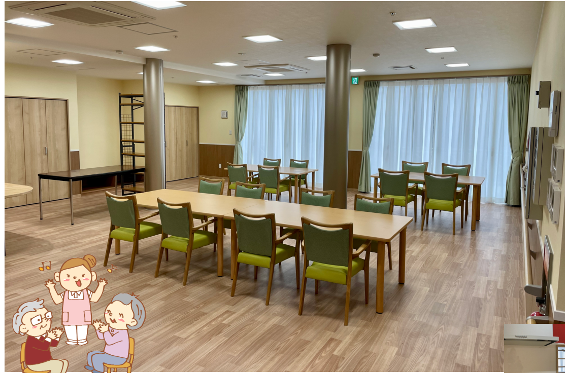
食堂・機能訓練室 利用定員に対して広い面積の部屋になっておりますので、食事や運動もゆとりのある空間で伸び伸びと行えます。利用者さんを見守れるように、キッチン是对面配置しています。